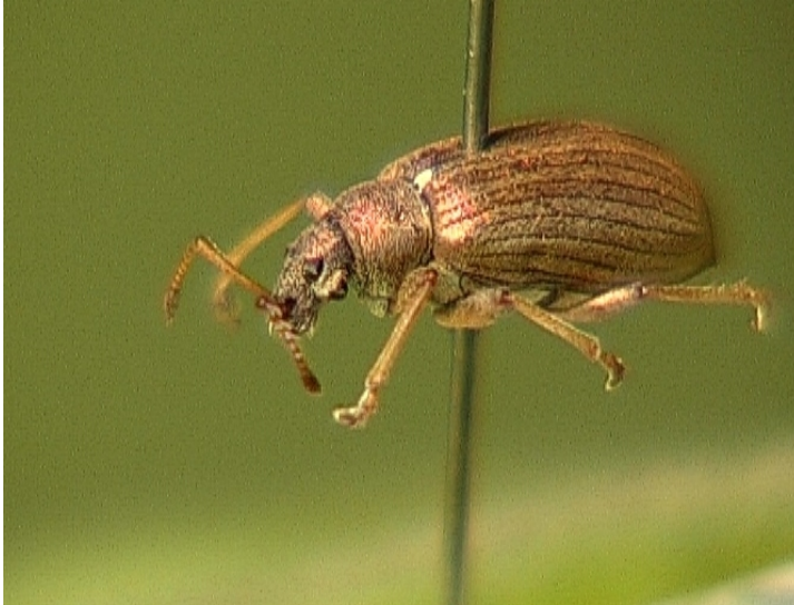
Bild 14: Grünrüssler ( Polydrusus ) mit zusätzlichem Auge

Käfern. Andere Käfer, sog. Krüppelformen, sind in ihrer ganzen Gestalt gedrungen.