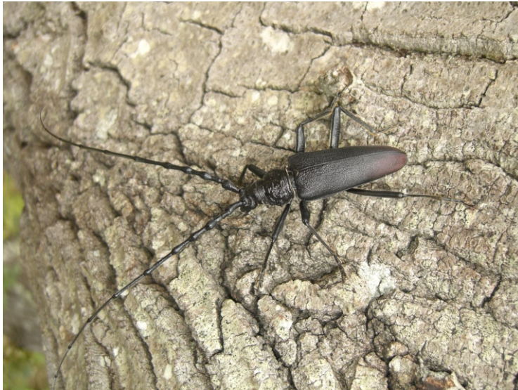
Bild 4: Der große Eichenbock auf der Eichenrinde

weite Verbreitung in früheren Zeiten macht die Tatsache ihrer Ankunft nicht sonderlich ungewöhnlich.