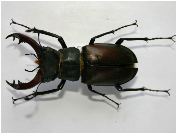
Bild 9: Hirschkäfer ( Lucanus cervus ) mit verkürzter Mittelbeinschiene und Tarsen