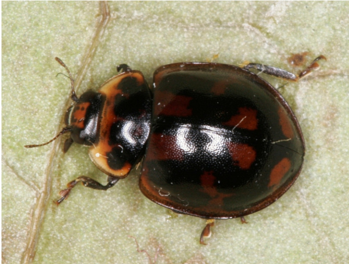
Bild 2: Schachbrett-Marienkäfer ( Propylea quatuordecimpunctata ) als dunkle Formmorphe

Käfern aufgefallen sind. Daraus resultierte eine kleine Bildersammlung von allem was „abnorm“ in der Käferwelt ist, die ich hier präsentieren möchte.