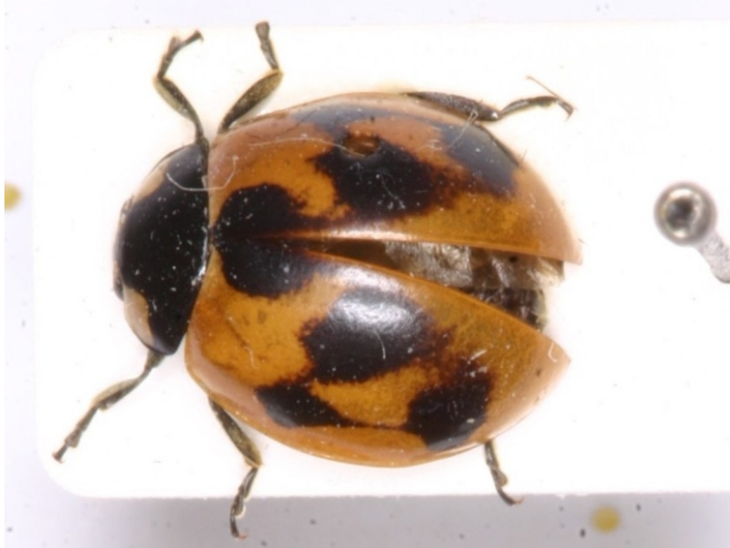
Bild 4: Siebenpunkt-Marienkäfer ( Coccinella septempunctata ) mit verlaufenen Punkten

Bei einer verwandten Marienkäferart, dem Vierzehnpunkt- oder Schachbrett-Marienkäfer ( Propylea quatuordecimpunctata ), fotografierte Christoph BENISCH eine komplett dunkle Farbmorphe.