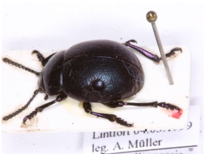
Bild 7: Tatzenkäfer ( Timarcha goettingensis ) mit Chitinauswölbung auf linker Flügeldecke

Manchmal kommt es vor, dass Käfer Chitin-Auswölbungen auf den Flügeldecken haben, die vielleicht beim Schlupf aus der Puppe entstanden sind, wie die beiden nachfolgenden Käfer.