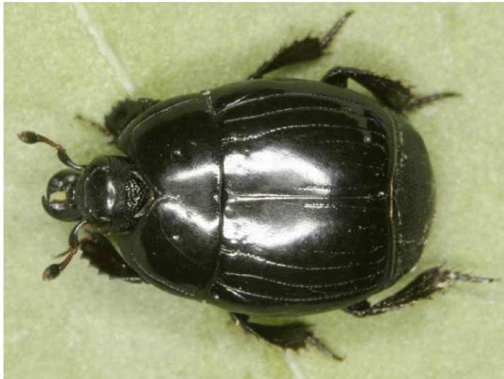
Bild 12: Stutzkäfer ( Margarinotus obscurus ) mit eingeschnittenem Halsschild

Der Schlupf aus der Puppe oder Störungen während der Puppenruhe können dazu führen, dass sich Gliedmaßen nicht richtig entwickeln können. So zeigen viele Käfer verkürzte Beine, bei denen die Schiene, der Oberschenkel oder die Tarsen verkürzt sind, wie bei den hier folgenden