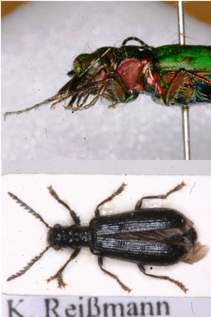
Bild 16: Feldsandlaufkäfer ( Cicindela campestris ) mit zusätzlichen Vorderbeinen