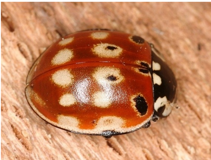
Bild 1: Augenfleckmarienkäfer ( Anatis ocellata ) mit reduzierten „Augenflecken“

Im September 2007 brachten mir meine Eltern einen, wie sie sagten „wunderschönen roten Käfer“ mit, den sie in ihrem Garten in Krefeld aufgesammelt hatten. Mein erster Blick sagte mir, nur ein Scharlachroter Feuerkäfer ( Pyrochroa coccinea ) und ich wollte ihn auch gleich wieder fliegen lassen, da fiel mir bei näherer Betrachtung auf, dass der Käfer zwei linke voll entwickelte Fühler hat. Diese Beobachtung führte dazu, dass ich im Internet und in der zugänglichen Insektenliteratur recherchierte bzw. mich bei Käfer-Kollegen und in Insektenforen erkundigte, ob Ihnen „Kuriositäten“ bei