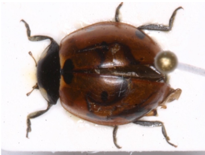
Bild 5: Siebenpunkt-Marienkäfer ( Coccinella septempunctata ) mit reduzierten Punkten

Manchmal kommt es vor, dass Käfer in ihrer Zeichnung variieren, das z.B. können zusätzliche Flecken oder Streifen auf den Flügeldecken sein. So hat der afrikanische Bockkäfer Analeptes trifasciata zwei bis drei Streifen auf jeder Flügeldecke, aber das hier gezeigte Tier hat einen Streifen auf der linken Flügeldecke mehr.