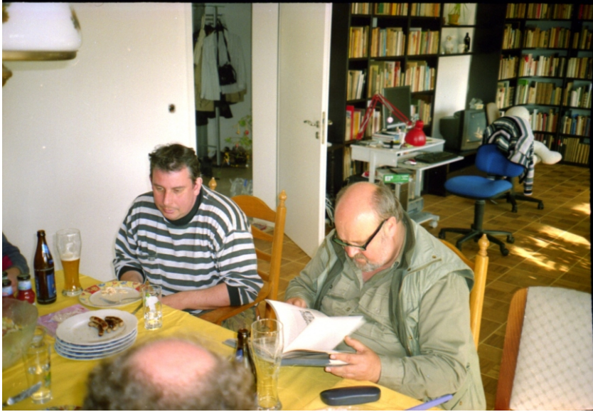
Abb. 14: Bücherschau

die hervorragenden Fotos von der Exkursion, unserem Mitglied Friedhelm BÄHR für die exzellenten Käferporträts.