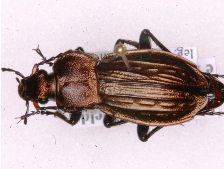
Bild 11: „Krüppelform“ der Körnerwarze ( Carabus cancellatus )