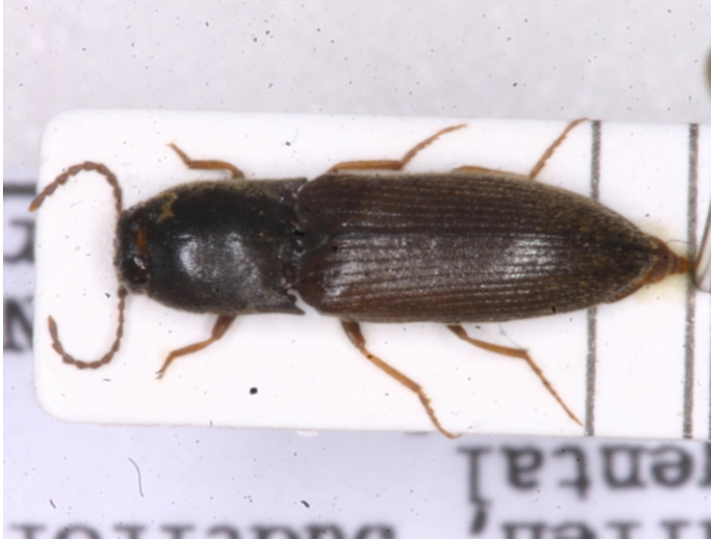
Bild 8: Saatschnellkäfer ( Agriotes ) mit komplett verkürzten Vorderbeinen