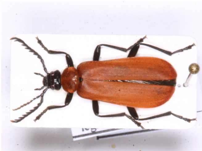
Bild 13: Scharlachroter Feuerkäfer ( Pyrochroa coccinea ) mit zusätzlichem Fühler

Der Schlupf aus der Puppe oder Störungen während der Puppenruhe können dazu führen, dass sich Gliedmaßen nicht richtig entwickeln können. So zeigen viele Käfer verkürzte Beine, bei denen die Schiene, der Oberschenkel oder die Tarsen verkürzt sind, wie bei den hier folgenden