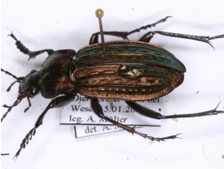
Bild 6: Körnerwarze ( Carabus cancellatus ) mit Chitinauswölbung auf linker Flügeldecke

Die im Weiteren abgebildeten Siebenpunkt-Marienkäfer ( Coccinella septempunctata ) zeigen einerseits verlaufene schwarze Punkte und andererseits können diese auch teilweise oder ganz reduziert sein oder fehlen.