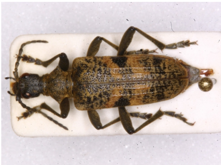
Bild 10: Zangenbock ( Rhagium mordax ) mit verwachsenen Fühlergliedern