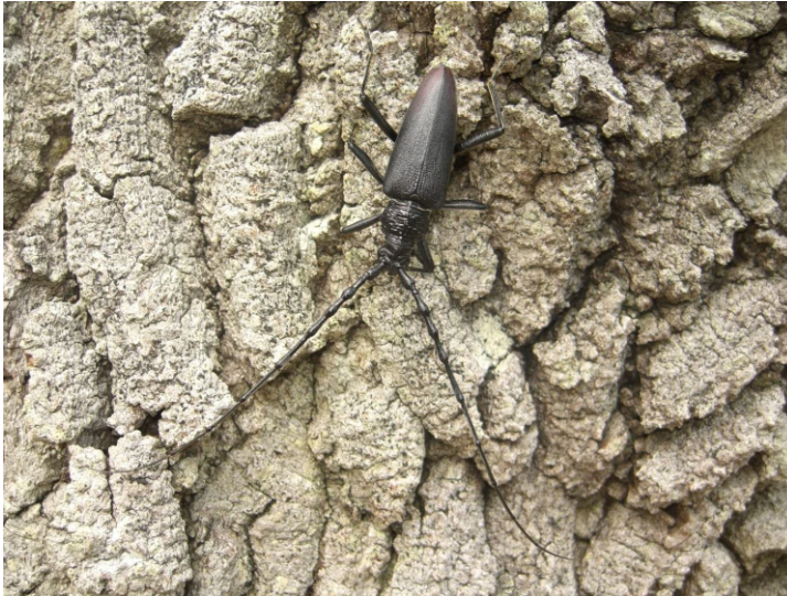
Bild 7: Der große Eichenbock ( Cerambyx cerdo ) auf der Eichenrinde

Der lange, dunkle Weg durch das Holz neigte sich im Herbst des vierten Jahres seinem Ende zu. Aus dem einstmals wenige Millimeter langen Rupchen war eine stattliche, fingerdicke und ebenso lange Made geworden.