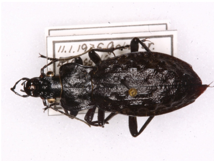
Bild 15: Grubenlaufkäfer ( Carabus nodulosus ) mit zusätzlichem Mittelbein

Die interessantesten Kuriositäten sind wohl, wenn Käfer zusätzliche Augen, Fußglieder, Beine oder Fühler haben, wie an Hand der Bilder 14 bis 17 gezeigt werden soll.