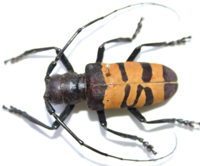
Bild 3: Analeptes trifasciata mit zusätzlichem Streifen

Viele Käferarten, wie beispielsweise Marienkäfer (Familie Coccinellidae) zeigen eine große Farbvariabilität innerhalb einer Art. Manchmal finden sich aber auch hier Formmorphen, die nur bei Einzelexemplaren gefunden werden. So findet man bei dem Augenfleck-Marienkäfer ( Anatis ocellata ) Tiere, bei denen die schwarzen Punkte der Augenflecken deutlich reduziert sind oder fehlen.